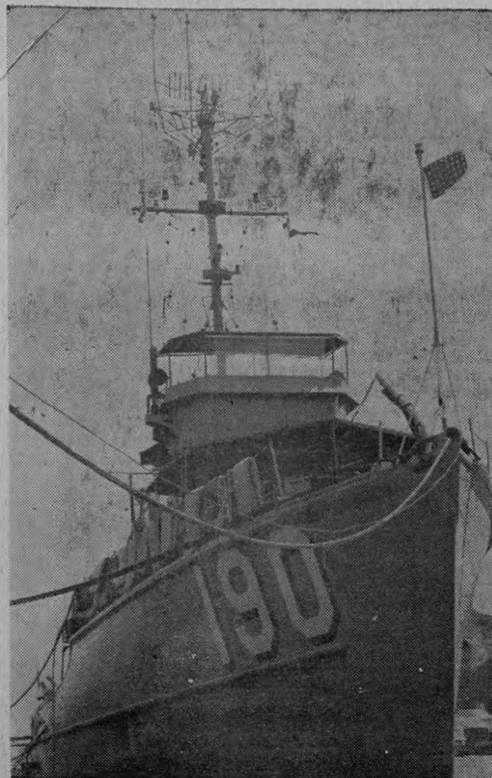
Este es el barreminas norteamericano Falcon, que mañana estará en Puntarenas para una visita de cortesía. Zarpó el viernes 7 y su tripulación vendrá a la capital.