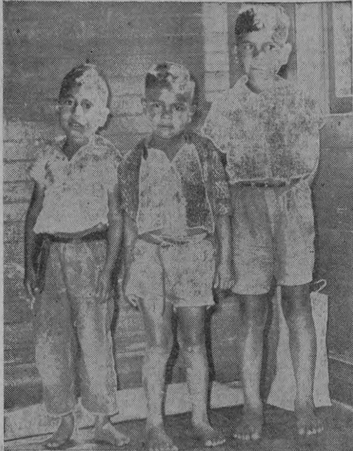
TRES DE LOS NIÑOS DETENIDOS.— Aparecen en la foto tres de los niños que fueron detenidos por deambular en las noches por las calles de San José. Están en la Escuela Militar de Guadalupe. Se ha emprendido una acción severa para tratar de amonestar a los padres de hogares deshechos que son responsables del problema social que encarnan estas criaturas.